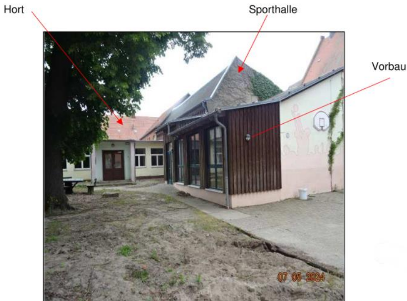
Hort, Sporthalle und Vorbau vor der Sporthalle

Gemarkung Stendal Flur 32, Flurstücke 151, 152 und 153/2 Größe gesamt: 1.452 m 2